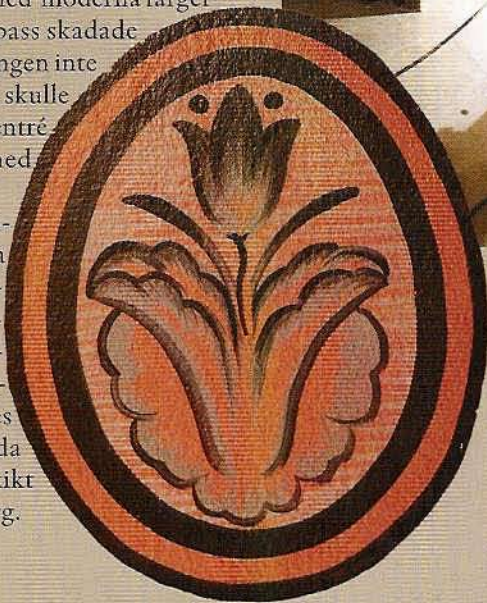
Den återkommande stiliserade blomman påminner om dalamaleriets kurbitsblomma.